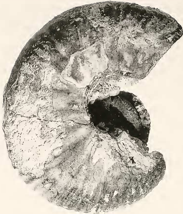
Abb. 3: Bullatimorphites parvadehi SEYED-EMAMI n. sp. 95-11-17. x1.

Die evolute Innenwindung (bei ca. 30 mm Durchmesser) besitzt eine feine Berippung. Auf dem letzten Abschnitt des Phragmokons und auf der Wohnkammer ist die Berippung dagegen auffallend grob. Die knotenartig verdickten Umbilikalrippen teilen sich auf der Flanke gewöhnlich in drei Sekundärrippen. Diese ziehen mit einem leichten, nach vorn gerichteten Bogen über die wohlgerundete Externseite.